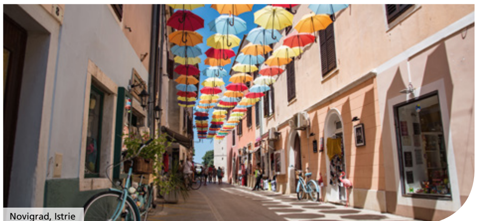
Novi Grad, Istrie