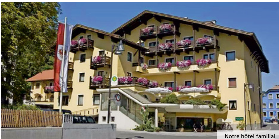
Notre hôtel familial

3e jour, Imst – Feldkirch – retour : Votre séjour tyrolien touche déjà presque à sa fin. Vous atteignez le Vorarlberg et Feldkirch dans la matinée. Balade libre dans la vieille ville avec ses ruelles étroites, ses arcades couvertes et ses magnifiques façades. Après le repas de midi en commun, voyage de retour en Suisse à votre lieu de départ.