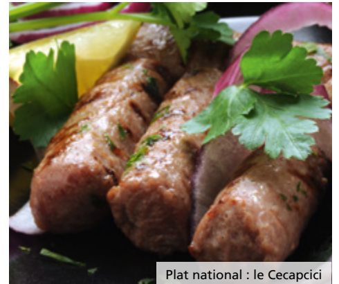
Plat national : le Cecač