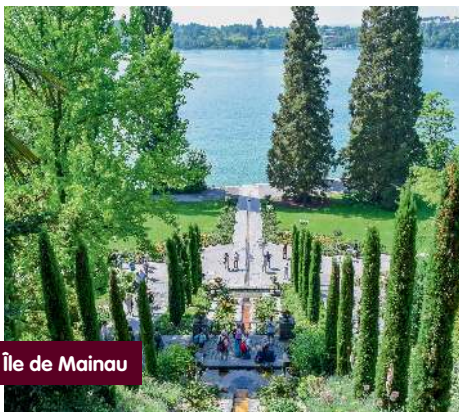
Île de Mainau

3e jour, île de Mainau - retour: Ce voyage de fin de saison se terminera par la visite de la perle du lac de Constance. A votre arrivée à Mainau, découverte de la célèbre île aux fleurs en compagnie de votre guide ou librement, selon vos envies. Un dernier repas en commun sur l'île clôturera cette escapade avant le retour sur votre lieu de départ.